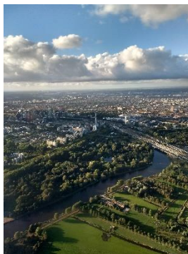
Aproximo al aeroportuo

Ka dum la tota renkontro anke parolesis pri Ido? Yes, certe. Erste ni astonesis pri la mikra anunci asistar l'Internaciona Ido-renkontro pos longa tempo. Kad esis timo pro Kovid? Ka l'Idisti esas fatigita pro omno? Ka l'Idisti esas tro olda? Ka la disto esis tro granda? Ni ne savas. La hotelo esis de bona qualeso, to ne povas esir la problemo. La programo esis sat interesanta, ed esis libereso chanjar la programo segun deziro. Regretebla