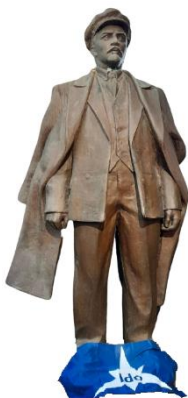
Lenin aprobas Ido