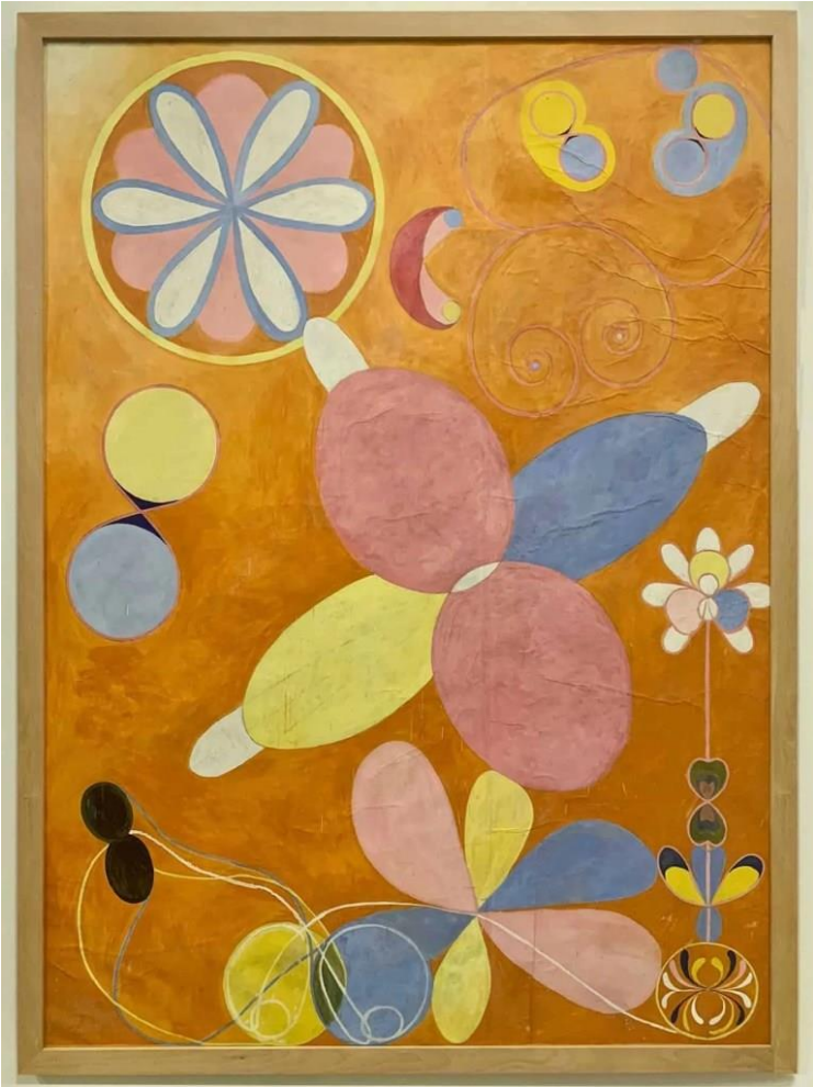
Verko da Hilma af Klint